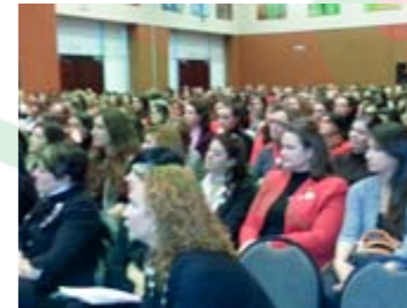
Asistentes atentas al vídeo de CCF

En este evento se vendieron más de 200 flores realizadas con los colores corporativos de la marca Mary Kay, calendarios y se inscribieron varias asistentes como nuevas socias. Gracias al encuentro se creó un canal de comunicación abierto a futuras colaboraciones con Mary Kay como patrocinadora de CcF.