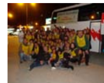
La familia de voluntarios de CCF