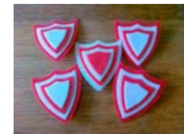
Escudos elaborados por voluntarios