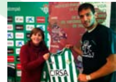
La presidenta de CCF junto a la figura del momento del Real Betis, el paraguayo Roque Santa Cruz

Crecer Con Futuro también estuvo presente el 3 de marzo en el estado Ramón Sánchez-Pizjuán del Sevilla F.C. en el encuentro que los sevillistas jugaron contra el Atlético de Madrid. En esta ocasión se convocaron a 100 voluntarios y se vendieron 4.200 escudos.