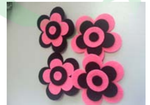
Flores corporativas Mary Kay